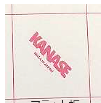
フラット板 赤文字